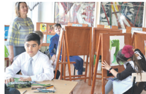
В изостудии школы № 4